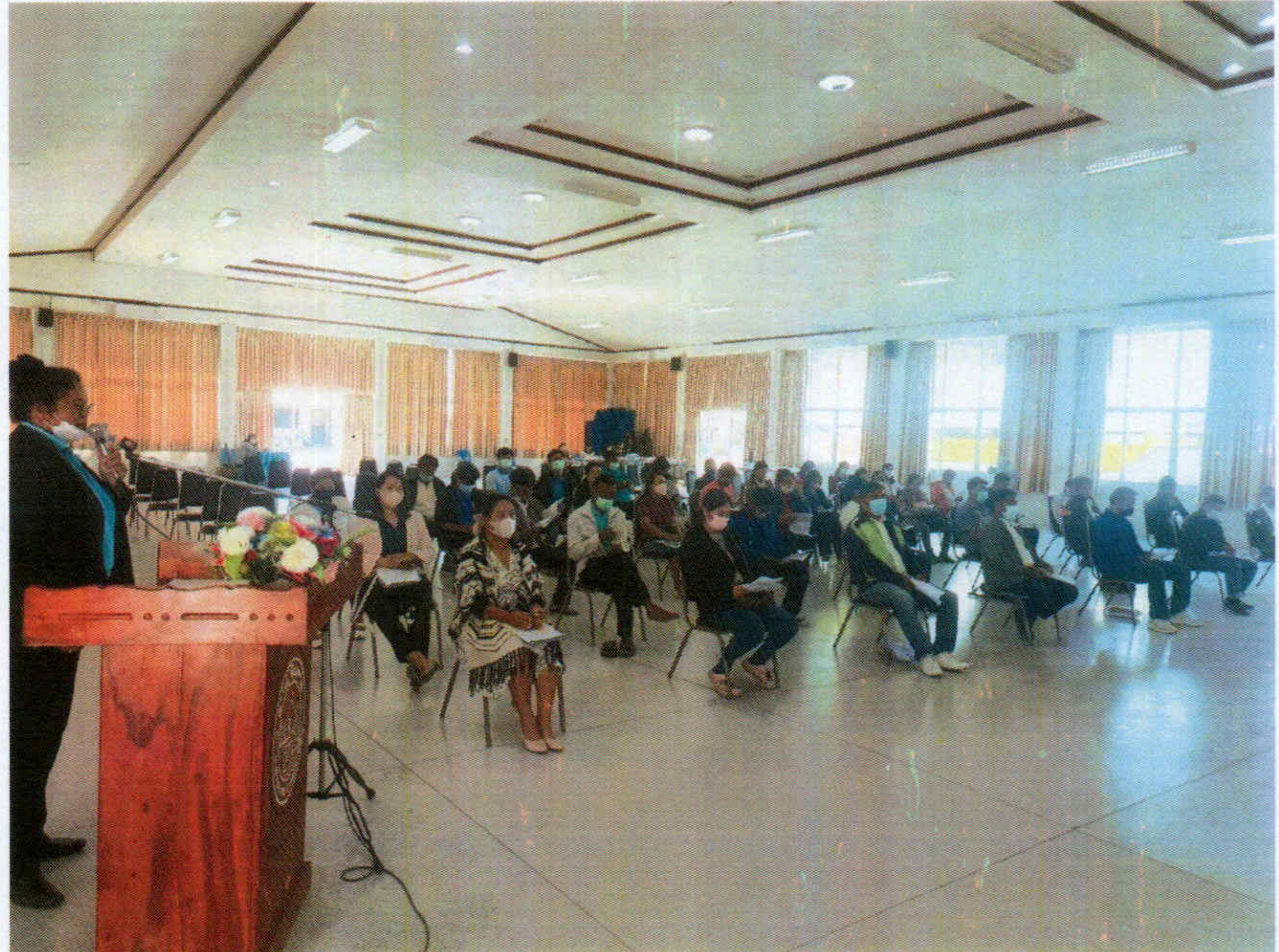
ภาพถ่ายโครงการ ประชุมประชาคมในการ เพิ่มแผนพัฒนาท้องถิ่น พ.ศ. ๒๕๖๖-๒๕๗๐ เพิ่มเติม ครั้งที่ ๑/๒๕๖๖